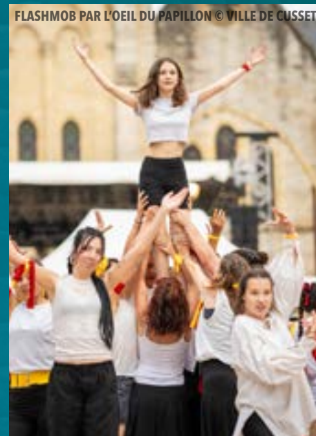
FLASHMOB PAR L'OEIL DU PAPILLON

Bijoux artisanaux, épices, jouets en bois pour enfants, macarons à l'ancienne, costumes, maquillage, romans fantastiques, accessoires en cuir... Si le décor se chargera de transporter les visiteurs en pleine époque médiévale, leurs papilles profiteront également du voyage.