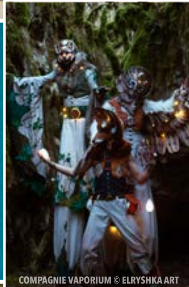
COMPAGNIE VAPORIUM © ELRYSHKA ART