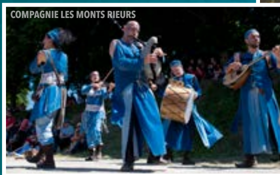
COMPAGNIE LES MONTS RIEURS