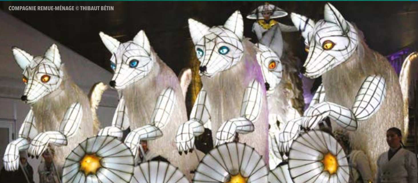
COMPAGNIE REMUE-MÉNAGE

Samedi soir, le public se laissera emporter par la parade fantastique qui s'élancera depuis le haut du boulevard de Gaulle pour rejoindre la terre du milieu sur la place Victor-Hugo et embraser la ville d'une ambiance féerique. Échassiers, musiciens, jongleurs et dragons défilent au cœur de ce cortège haut en couleurs, accompagnés des impressionnants renards blancs lumineux de la Compagnie Remue-Ménage , créatures mythiques et légendaires. Pour clôturer cette soirée en beauté, le groupe Les Monts Rieurs investira la place avec un concert survolté aux sonorités « pop ethno folk ».