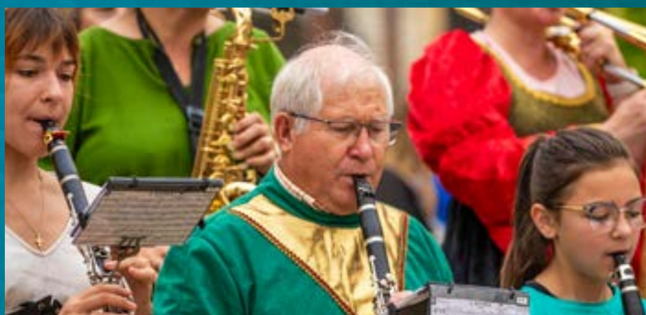
HARMONIE LA SEMEUSE