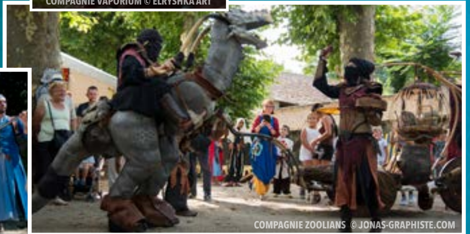
COMPAGNIE ZOOLIANS