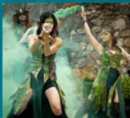
COMPAGNIE OPALE DE LUNE