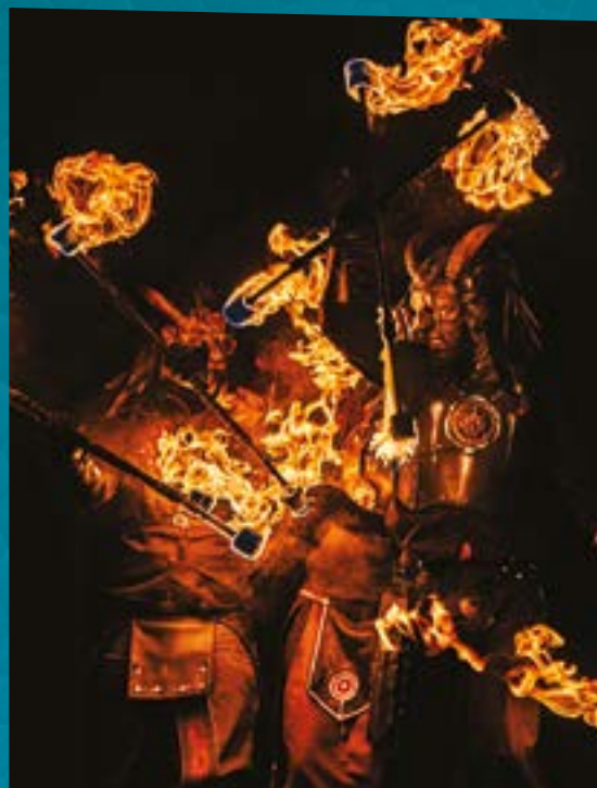
COMPAGNIE VAPORIUM

Entièrement chorégraphié et servi par une imposante scénographie, la place Victor-Hugo et les visiteurs profiteront d'une puissante bande-son tribal-pagan.