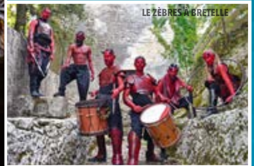
LE ZÈBRES À BRETELLE