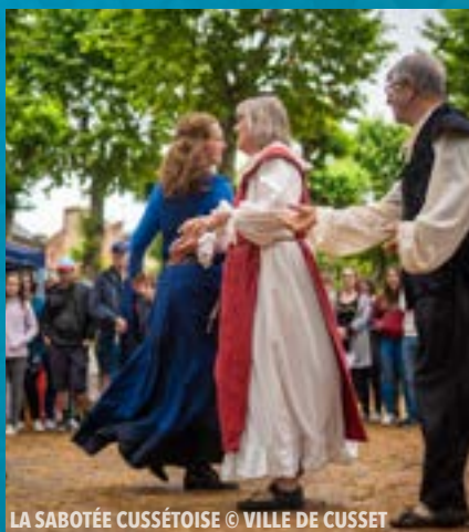
LA SABOTÉE CUSSÉTOISE

Les associations et les acteurs locaux se produiront aux côtés des compagnies professionnelles tout au long du week-end : Harmonie la Semeuse • Conseil citoyen • Atelier Mermet • Tanawa • La Sabotée Cussétoise • L'Œil du Papillon • Choeur au Joly Bois • American Dream • Les Fées Tisseuses • Les Poids Sont Plumes • Paroisse Saint-Joseph-des-Thermes • Les Amis du Vieux Cusset • Les Comités de quartier de Cusset • Conseil Communal des Jeunes • COS de Cusset • SAGESS.