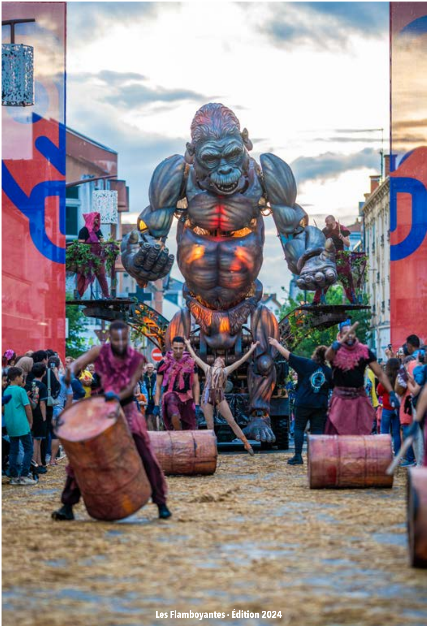
Les Flamboyantes - Édition 2024