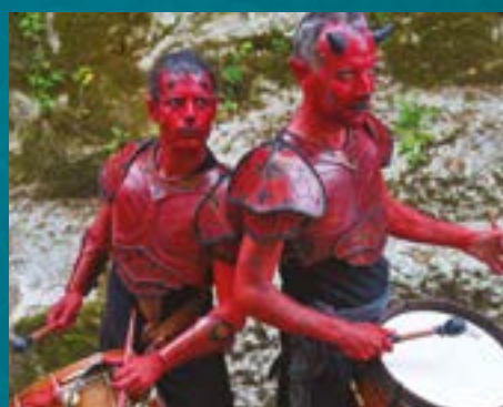
COMPAGNIE LE ZÈBRE À BRETELLE