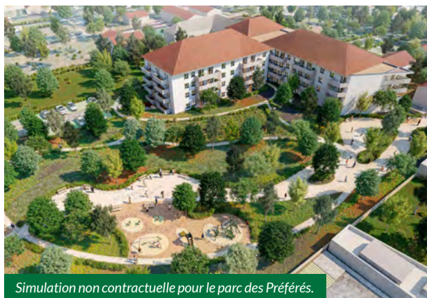
Simulation non contractuelle pour le parc des Préférés.

filiale de développement immobilier de Vinci Construction comprenant 90 logements (T1 et T2) surplombant des commerces de proximité. Ces logements et espaces de stationnement seront implantés dans un parc végétalisé aménagé par la Ville de Cusset, offrant des espaces conséquents préservant la biodiversité avec de nombreux refuges et nichoirs pour un cadre de vie agréable à deux pas du centre-ville. Ce parc sera un véritable îlot de fraîcheur, à l'arrière du Palais de Justice où seront implantées différentes infrastructures : jeux pour enfants, terrain de pétanque, zone de pique-nique, et une traversée Nord-Sud entre le boulevard des Gravieres et la rue des Préférés.