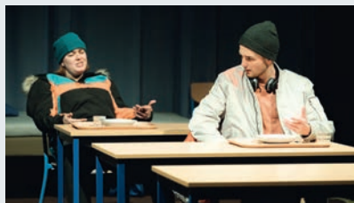
@Alban van Wassenhove

"Vous m'avez tué". Voici le genre de post glaçant qu'il est possible de lire sur les réseaux sociaux... C'est en tous cas le point de départ de la pièce « Seuil » de la compagnie Les Grandes Marées qui sera jouée au Lycée Albert-Londres. Alternant interrogatoire et flash-back, la pièce recomposera le puzzle de cette enquête et dévoilera les raisons qui ont mené au drame. "Seuil" interroge les mécanismes de la violence, les hiérarchies faites entre hommes et la notion de consentement.