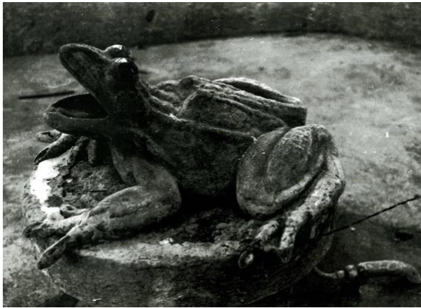
Sculpture de la première grenouille par Robert Mermet