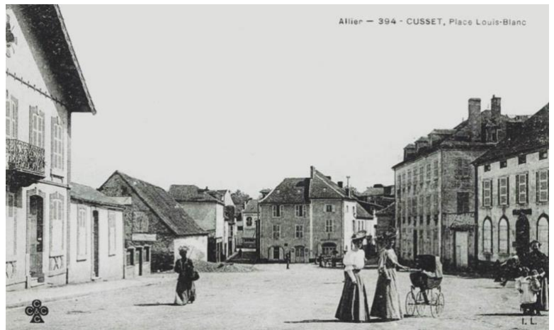
Place Louis-Blanc – XIX e siècle