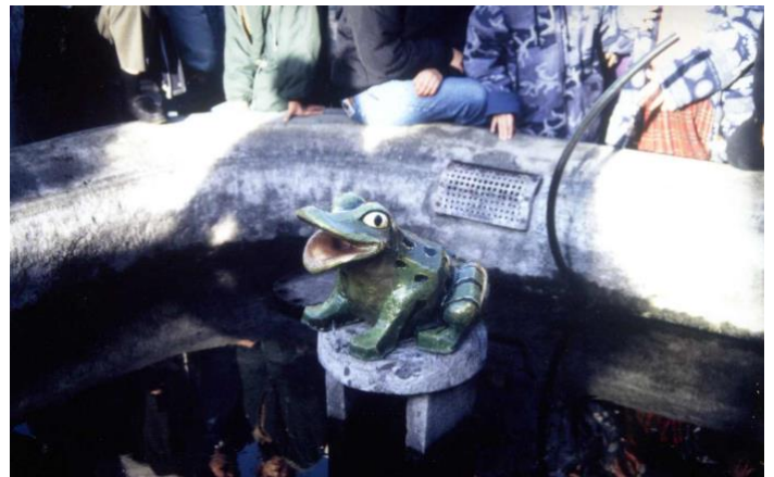
Deuxième grenouille réalisée par les enfants de l'Institut Médico Pédagogique du Moulin de Presles

2019 marquera donc, le retour de la grenouille. Car, dans le cadre de la rénovation du centre-ville, les élus cussétois ont souhaité redonner vie à ce petit square laissé à l'abandon.